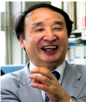
講演：金子 勝さん 立教大学大学院特任教授 テレビ・ラジオでおなじみの 経済学者

岸田政権は、原発の新增設、運転期間の延長へ政策転換をしました。今こそ、私たち一人ひとりの声と行動で原発ゼロを実現しましょう。この集会に参加することがその第1歩になります。